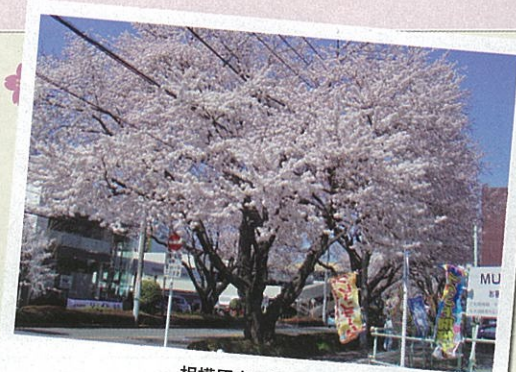
相模原市の標本木

クラが相模原市の標本木となっています。消防活動の参考とするため、らの開花宣言」と「満開宣言」を行っています。