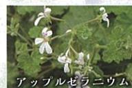
アップルゼラニウム

小さな丸い葉は、リンゴのようなフルーティな香りがします。匍匐性（ほふくせい）なので、ハンギング仕立てに人気の品種です。小さくて白い花を咲かせます。