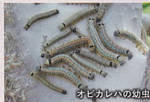
オビカレハの幼虫

オビカレハ(5月)、アメリカシロヒトリ(7~9月)、モンクロシャチホコ(9月)の毛虫類は発生初期の群棲している時に捕殺します。