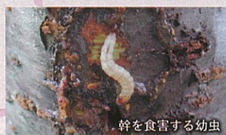
幹を食害する幼虫