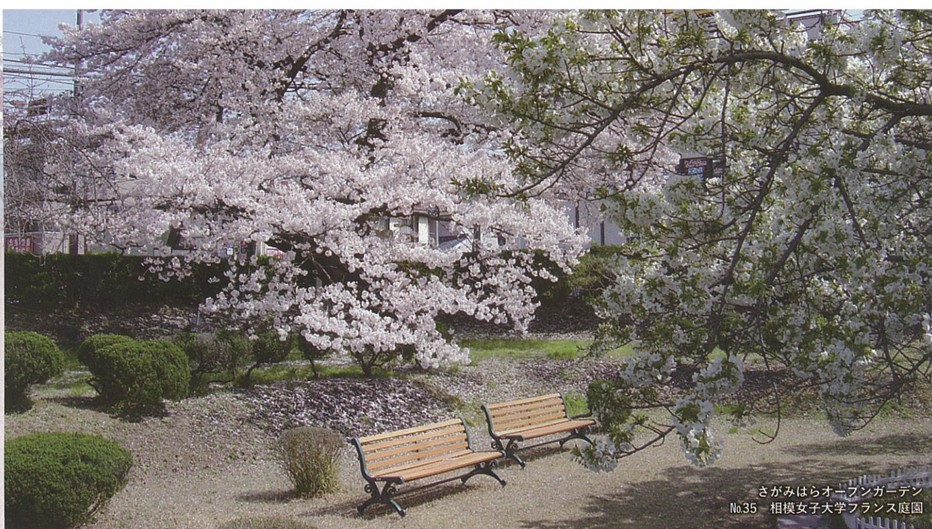
さがみはらオープンガーデン No.35 相模女子大学フランス庭園