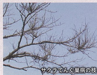
サクラてんぐ巣病の枝

カビの一種、胞子が飛散して伝染していく病気で、感染すると小枝が異常に発生し、花がつかなくなります。