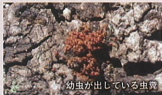
幼虫が出している虫糞