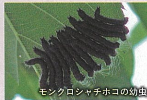
モンクロシャチホコの幼虫

文 岡部 誠 (相模原市さくらさくプロジェクト推進協議会顧問)